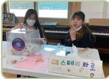
학생 자치 행사