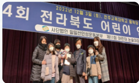
< 제4회 전라북도 어린이 인성의 날 기념식 및 제11회 전라북도 어린이 논술대회 시상식 >