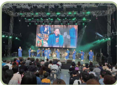
학부모 문화 관람