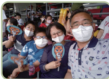
학부모와 함께하는 체험학습