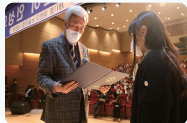
< 논술대회 수상자 >