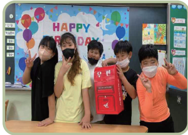
학생 자치 생일파티